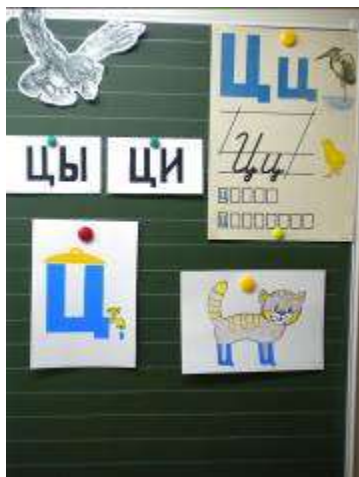
Рис. 2 Вот такая буква Ц(э), С коготочком на конце. Коготок – царапка, Как кошачья лапка!

Рис. 1 Буква Ц(э) - внизу крючок, Точно с краником бачок!